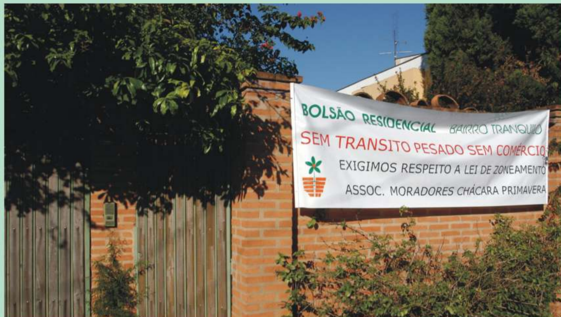
Lei de Zoneamento: Morador expõe no muro da residência faixa com exigências