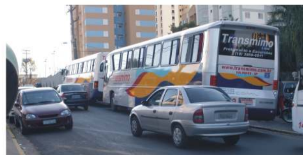
Pouco espaço exige manobras arriscadas

Enquanto a Actionline, empresa de telemarketing com mais de 1 mil funcionários, localizada na rua Jasmim, não constrói o recuo na calçada para o acesso dos ônibus, o problema só se agrava.