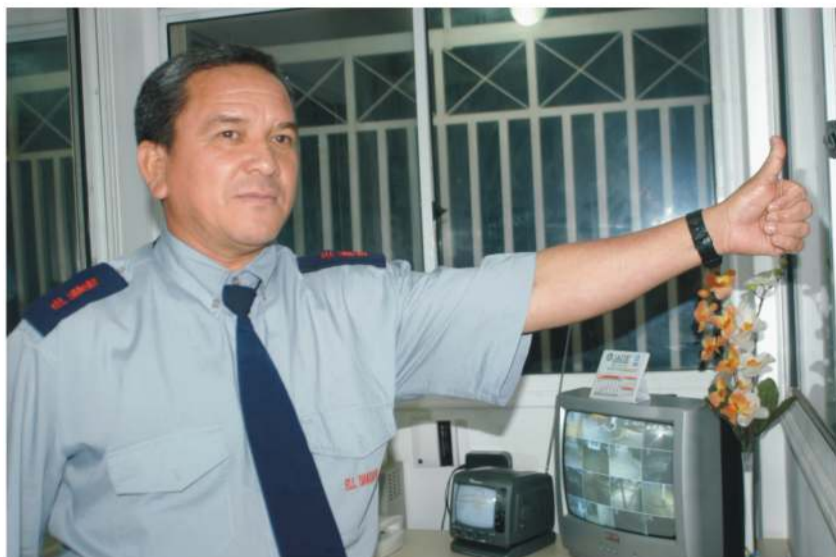
Ninguém passa pela portaria do Condomínio Garopaba sem um aceno

“Lá não cai no chão moeda de 50 centavos só de 1 real para cima”