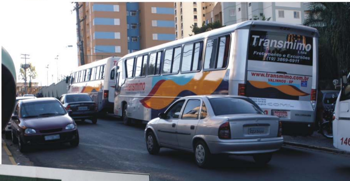
Jasmim: Ônibus param diante da empresa e travam a rua

"Sabemos que o transporte dos nossos funcionários causa impacto sobre o trânsito local, mas há outros fatores que devem ser considerados. Mesmo assim, vamos fazer o recuo", afirmou.