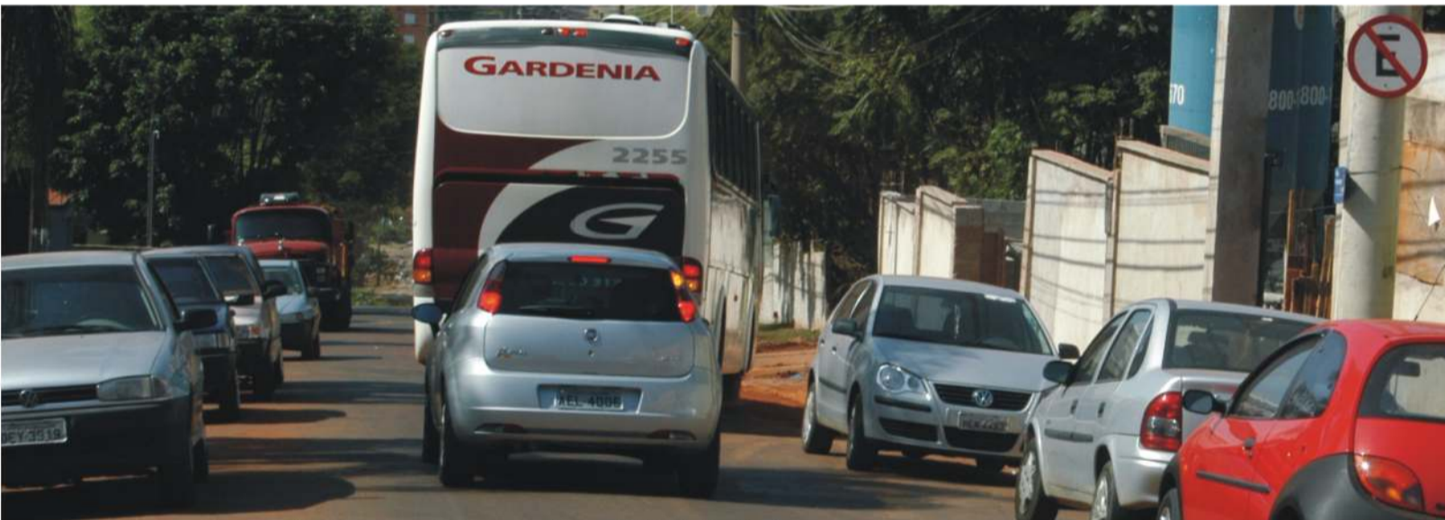
A rua Hermantino Coelho teve o estacionamento proibido à direita de quem desce mas, sem fiscalização, o problema continua